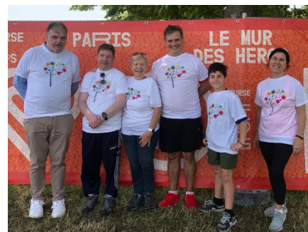
Membres du Bureau et du Conseil d'Administration de Schizo Oui Course des Héros Paris 19 juin 2022